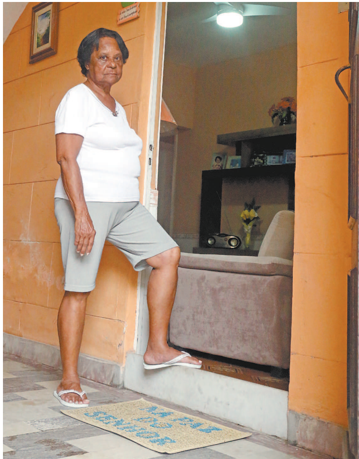
Moradora fez uma barreira na porta para impedir entrada da água

muita coisa. Tive que tomar essa medida, mas, mesmo assim, a água quase ultrapassou a barreira”, conta.