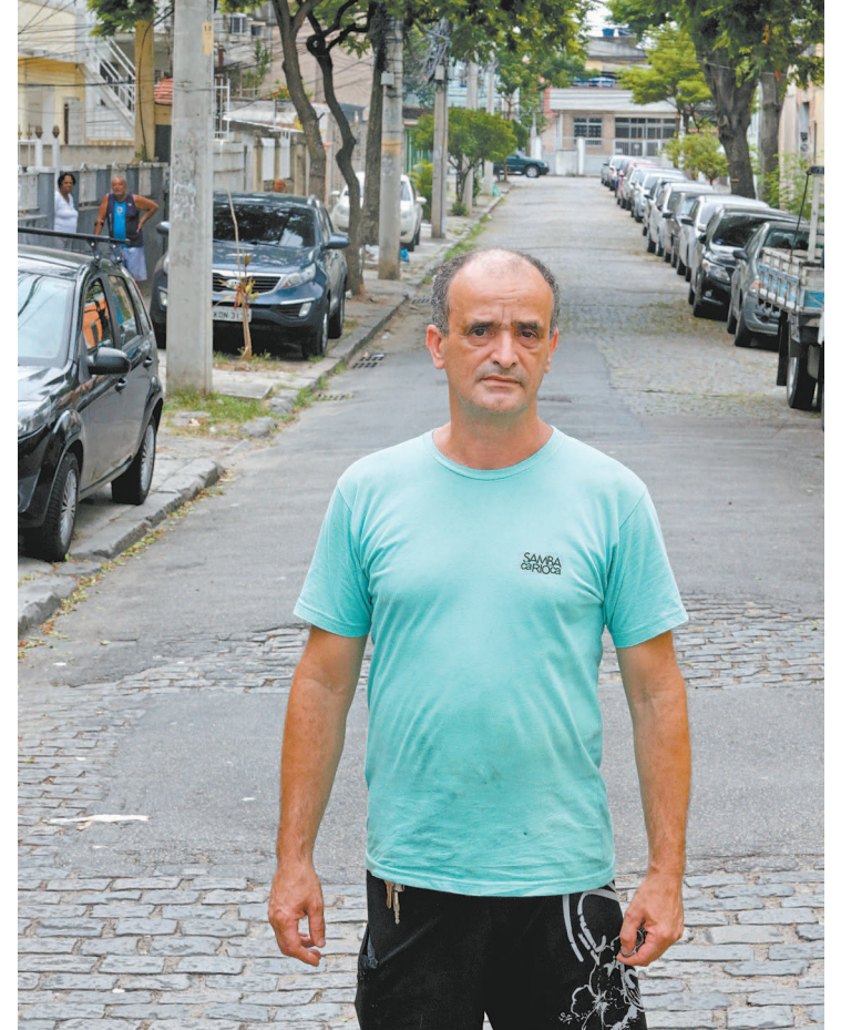
Parte da Rua Dr. Niemeyer não tem asfalto e está toda remendada

Moradores do Engenho de Dentro sofrem com constantes alagamentos, falta de iluminação pública e ruas esburacadas